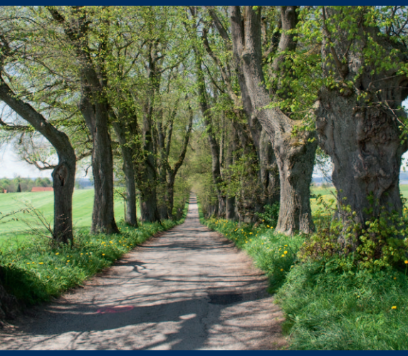
Einen Abstecher wert – Kurfürstenallee Marktoberdorf

24 Abschließend weist Sie am Augsburger Wertachweg ein Wegweiser auf die Wertachmündung hin, die nach einigen hundert Metern erreicht wird.