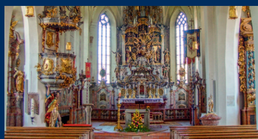
Wallfahrtskirche Hl. Kreuz in Maria Rain

im Vordergrund. Aus diesem Grund führt die Strecke oft über naturbelassene Wege und sucht wo möglich die Nähe zur Wertach.