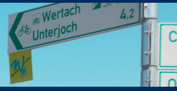
Dieser Beschilderung bitte folgen