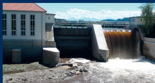
Bärenseerkraftwerk bei Kaufbeuren

Darüber hinaus finden Sie in nahezu jedem Weiler eine Pfarrkirche oder Kapelle, die oft hunderte Jahre alt sind. Besonders hervorzuheben sind dabei die St. Sebastianskapelle bei Wertach, liebevoll auch „Kleine Wies“ genannt, die Wallfahrtskirche Hl. Kreuz in Maria Rain