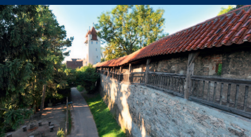
Historische Stadtmauer in Kaufbeuren mit Fünfknopfturm

Im südlichen Bereich locken etliche Panoramaplätze, bei denen die Berggipfel zum Greifen nahe scheinen. Zahlreiche Seen locken mit einer Schar an Wasservögeln, laden im Sommer aber auch zum Baden ein. In der Wertachschlucht bei Nesselwang lohnt sich auf jeden Fall ein