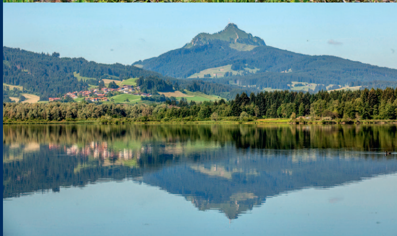
Der Grüntensee bei Wertach

im Vordergrund. Aus diesem Grund führt die Strecke oft über naturbelassene Wege und sucht wo möglich die Nähe zur Wertach.