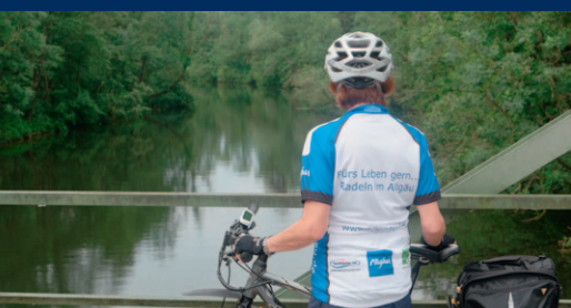
Die Wertach bei Schlingen

Die Wertach ist mit einer Länge von etwa 145 km der zweitlängste Fluss im Allgäu. Sie entsteht durch den Zusammenfluss der Bäche Kaltenbrunnbach und Eggbach unweit von Oberjoch im Landkreis Oberallgäu in den Allgäuer Alpen.