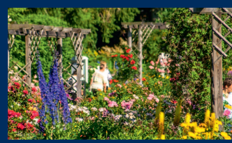
Kurpark Bad Wörishofen

21 Bei einer alten Eisenbahnbrücke überqueren Sie die Wertach und folgen der Beschilderung Richtung Zentrum (2,9 km).